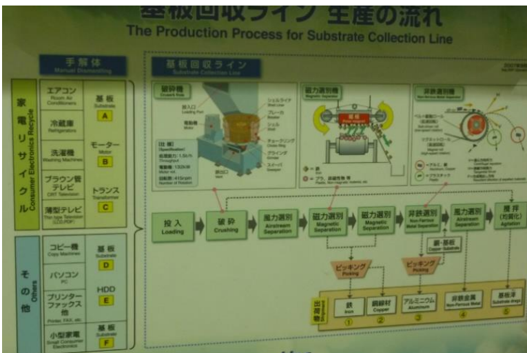
リサイクルの例 基板改修ライン生産の流れ

感想: 2001年にスタートした家電リサイクル法によりエアコン、冷蔵庫、テレビ、洗濯機の家電4品目が対象となった。現在の家電リサイクルの再商品化率(引き取られた使用済み家電から部品や材料を分け、新しい製品の部品や原材料とし再利用したり、供給できる割合)は85%以上となっており、2001年スタート当初から20%以上改善されている状況に驚くばかりです。人手による分解作業と粉碎・分別処理システムの技術開発によって、鉄・ステンレス・銅・アルミ・プラスチック・フロンを回収し、高い再資源化率を実現している現状を知ることができた見学会となった。