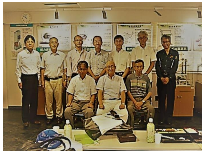
対応者及び参加者